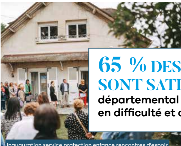
Inauguration service protection enfance rencontres d'espoir à Esbly • 17/09/23

65 % DES SEINE-ET-MARNAIS SONT SATISFAITS des actions du Conseil départemental et des aides en faveur des familles en difficulté et de la petite enfance*