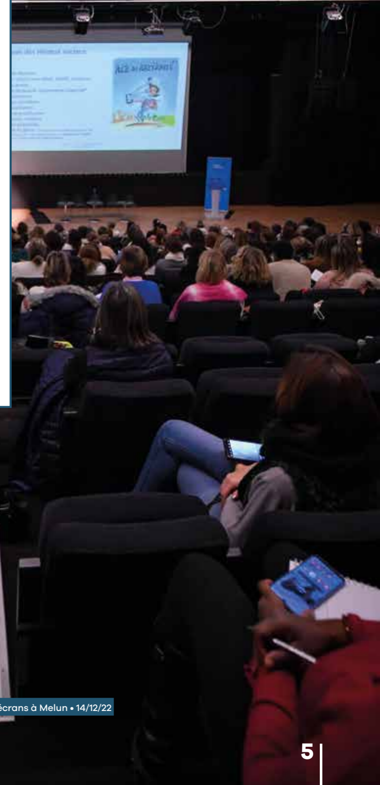
Conférence sur la surexposition aux écrans à Melun • 14/12/22

En complément de ses interventions de sensibilisation auprès des collégiens seine-et-marnais, le Département entend mener une action spécifique en direction des jeunes enfants qui peuvent développer des troubles du comportement et des handicaps à cause d'une mauvaise utilisation des outils numériques et d'une surexposition aux écrans. Il s'agit de proposer une offre de soins, afin de limiter au maximum l'impact de la surexposition aux écrans sur le développement des plus petits. Des consultations dédiées, des formations à destination des professionnels de la Protection maternelle et infantile, des campagnes de sensibilisation auprès des assistants maternels et familiaux ou, encore, l'organisation d'évènements feront partie des opérations qui viendront alimenter cette stratégie inédite en France.