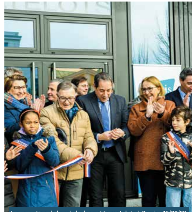
Inauguration de la crèche les petits matelots à Serris • 15/02/23