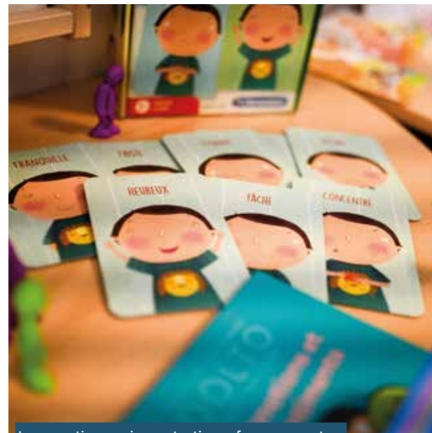
Inauguration service protection enfance rencontres d'espoir à Esbly • 17/09/23