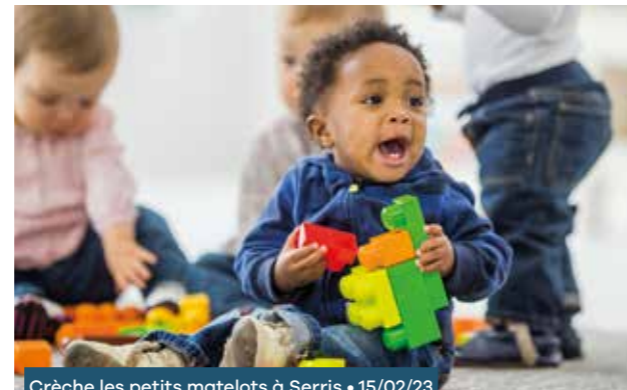
Crèche les petits matelots à Serris • 15/02/23

monoparentales, constitue un frein majeur de retour à l'emploi. C'est pourquoi, le Département s'est associé avec la CAF et France Travail pour développer le dispositif des crèches « à vocation d'insertion professionnelle » (AVIP) qui permet à des parents d'enfants de moins de trois ans de disposer de places réservées dans un établissement d'accueil et de bénéficier, en parallèle, d'un accompagnement dans leurs démarches d'insertion professionnelle par les services de France Travail.