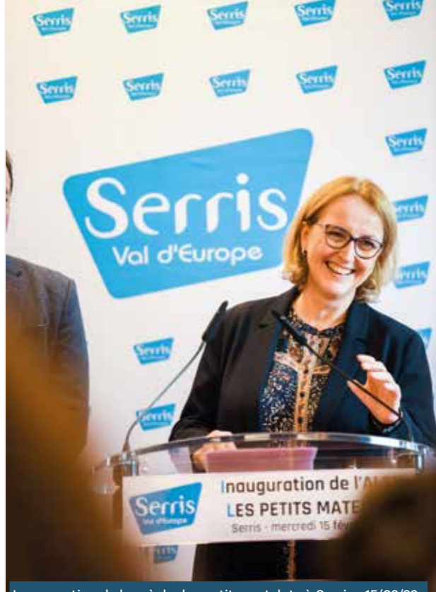
Inauguration de la crèche les petits matelots à Serris • 15/02/23