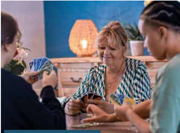
Assistante familial du Département