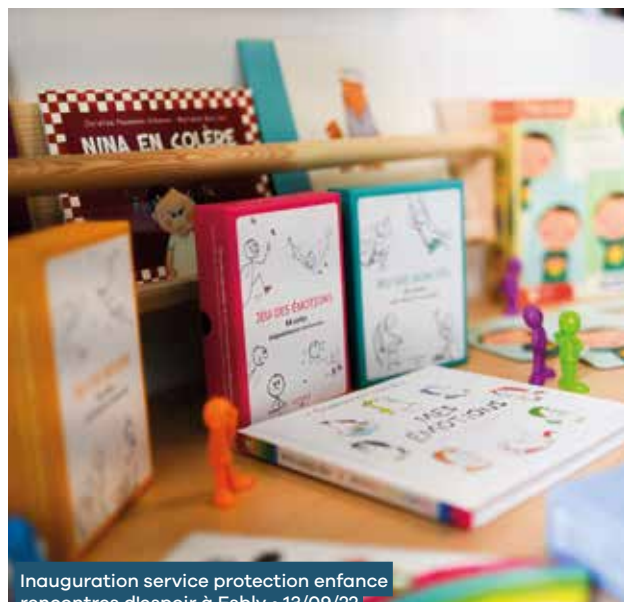
Inauguration service protection enfance rencontres d'espoir à Esbly • 13/09/22

Le schéma innove dans son élaboration en ce qu'il s'appuie, pour beaucoup, sur les retours d'expérience que peuvent faire les enfants confiés, ou qui ont été confiés, à l'ASE dans le cadre du Junior Lab et de la Commission de surveillance du SDAU.