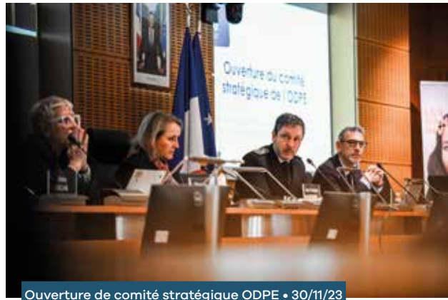
Ouverture de comité stratégique ODPE • 30/11/23