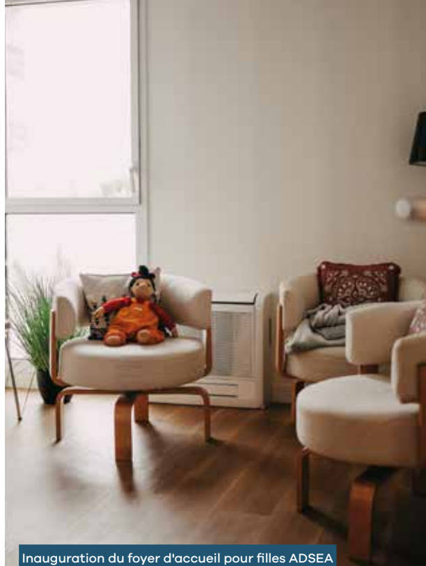
Inauguration du foyer d'accueil pour filles ADSEA à La Rochette • 27/09/23