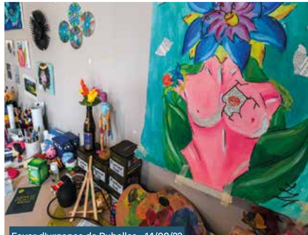
Foyer d'urgence de Rubelles • 14/09/22