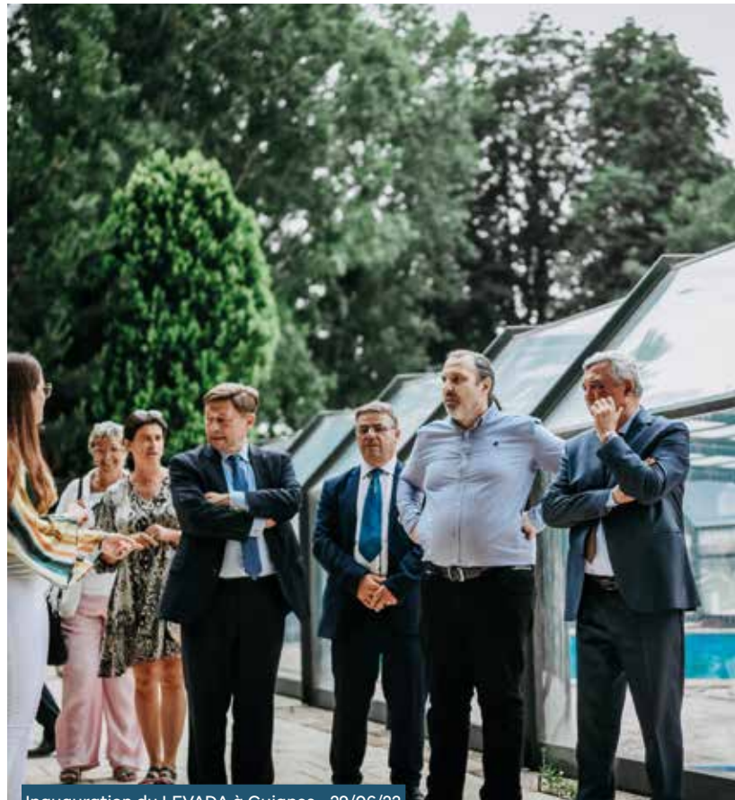
Inauguration du LEVADA à Guignes • 29/06/23

Le Levada est le premier lieu de vie et d'accueil autorisé protection de l'enfance en Seine-et-Marne. Inaugurée en juin 2023, cette structure, située à Guignes, accueille plusieurs enfants pour leur apporter, au quotidien, un accompagnement continu et favoriser leur insertion sociale. Elle exerce une mission d'éducation, de protection et de surveillance adaptée à leur handicap. Elle s'inscrit dans le Plan de développement de nouvelles places de l'ASE, formalisé par le lancement récent d'un nouvel appel à projets, pour disposer d'une offre d'accueil suffisante et adaptée aux besoins de chacun, alors que les mineurs en danger augmentent malheureusement sur notre territoire.