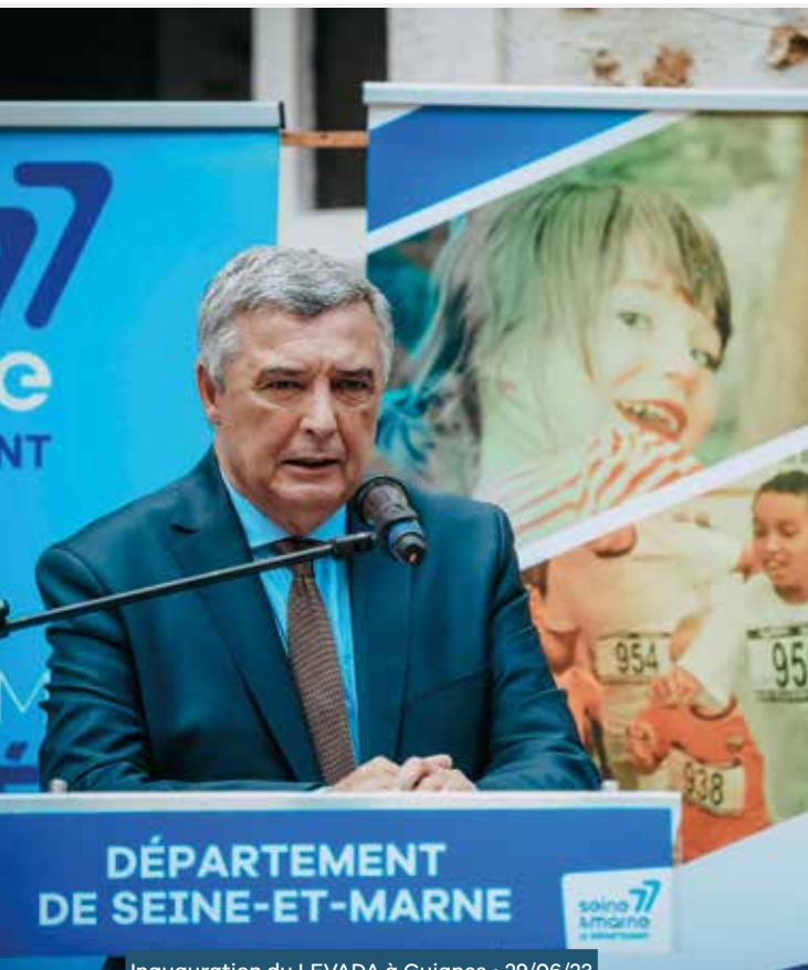
Inauguration du LEVADA à Guignes • 29/06/23