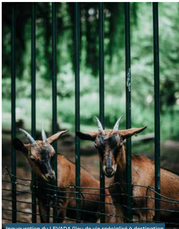
Inauguration du LEVADA (lieu de vie spécialisé à destination des enfants autistes) à Guignes • 29/06/23