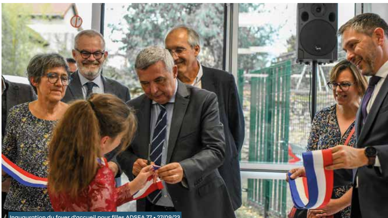
Inauguration du foyer d'accueil pour filles ADSEA 77 • 27/09/23