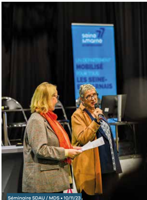
Séminaire SDAU / MDS • 10/11/23

Le nouveau Service départemental d'accueil d'urgence (SDAU), entré en vigueur depuis le 1 er janvier 2023, cherche à garantir à chaque enfant une équité de traitement quelle que soit sa situation, en tout point du territoire, à améliorer la qualité de service en plaçant les enfants au centre des actions menées et à assurer l'efficacité et la lisibilité du dispositif.