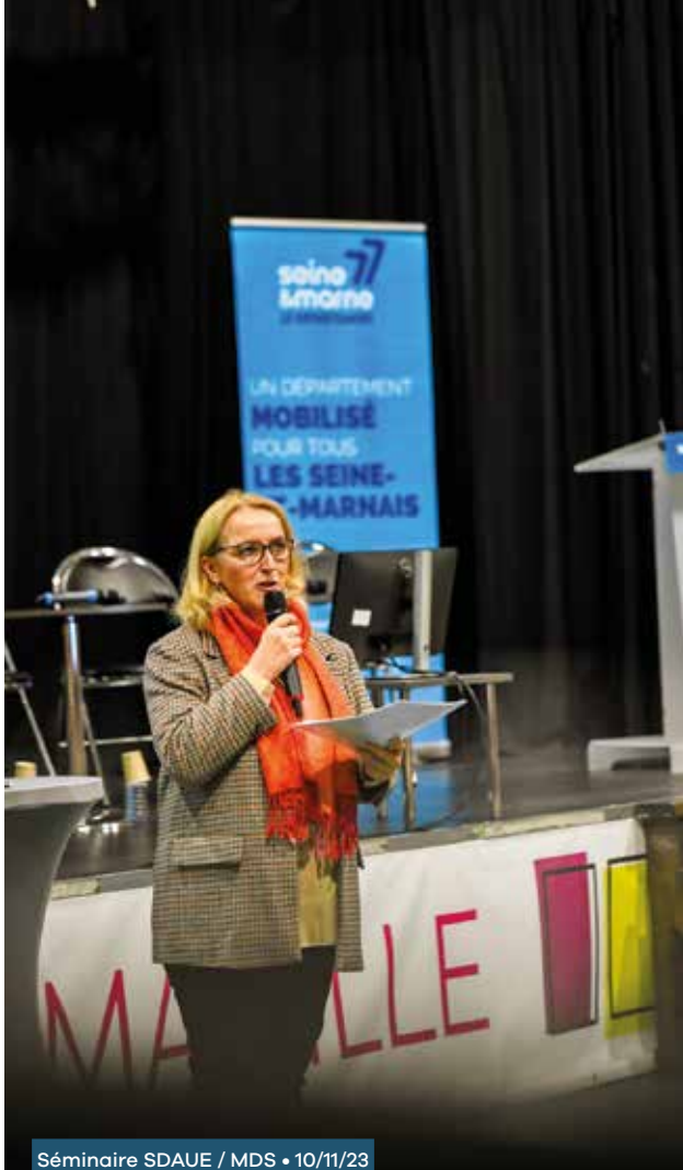
Séminaire SDAUE / MDS • 10/11/23