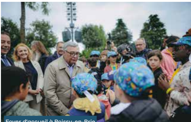
Foyer d'accueil à Roissy-en-Brie

Le Département de Seine-et-Marne a entrepris la rédaction d'un nouveau Schéma de protection des enfants et des familles qui permettra, en lien avec ses différents partenaires, de définir sa politique en matière de protection de l'enfance pour les 5 prochaines années, que ce soit sur le volet de la qualité de la prise en charge, de l'adaptation de son dispositif d'accueil et d'accompagnement, de la valorisation des compétences familiales ou, encore, de la sécurisation de la sortie de l'ASE.