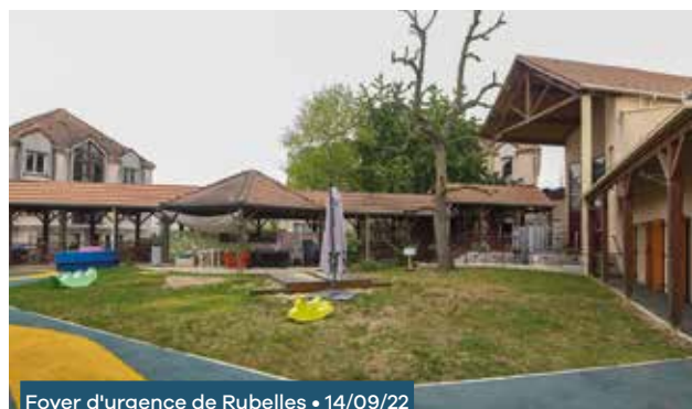
Foyer d'urgence de Rubelles • 14/09/22