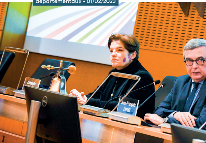
Rencontre avec les comités sportifs départementaux • 01/02/2023

UNE SESSION DE FORMATION organisée en 2023 avec 24 PARTICIPANTS ET 2 SESSIONS PRÉVUES EN 2024