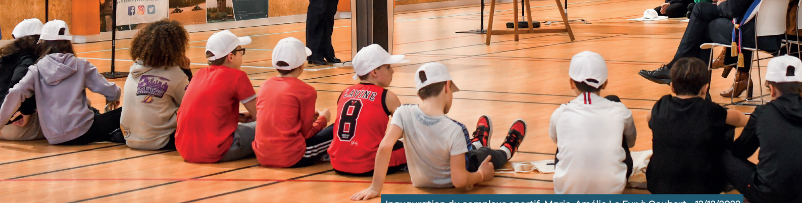
Inauguration du complexe sportif Marie-Amélie Le Fur à Coubert • 12/12/2023