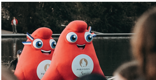
Cérémonie d'ouverture Minipag à Vaires-sur-Marne • 06/10/2023