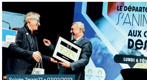
Soirée Team77 • 07/02/2023