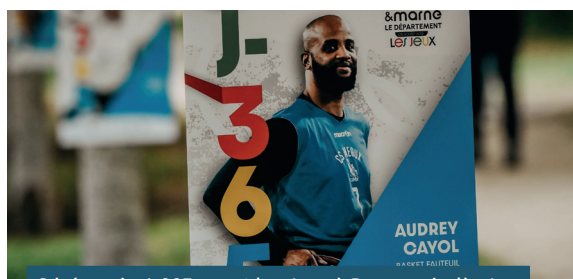
Cérémonie J-365 avant les Jeux à Dammarie-lès-Lys

173 volontaires formés gratuitement (anglais, PSC1, culture olympique, participation aux événements sportifs sur le territoire) dont près de 90 ont intégré le programme Volontaires de Paris 2024