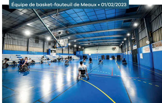
Équipe de basket-fauteuil de Meaux • 01/02/2023

Projet global du Département désigné « projet phare » de la Conférence des Financeurs du sport en Île-de-France Une enveloppe de 200 000 € de l'Agence Nationale du Sport pour financer les formations, l'acquisition de petit matériel pour la pratique, et deux postes d'éducateurs dont un itinérant pour le sport adapté