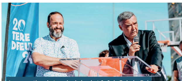
Inauguration du terrain de basket 3x3 de Bois-le-Roi 03/09/2023