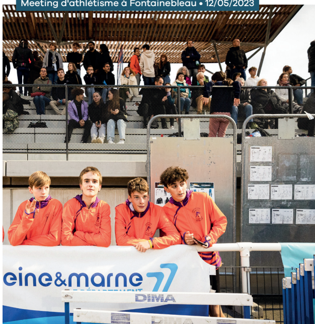
Meeting d'athlétisme à Fontainebleau • 12/05/2023

4 108 010 € mobilisés par le Département au titre de sa participation au coût de fonctionnement des équipements sportifs des collèges