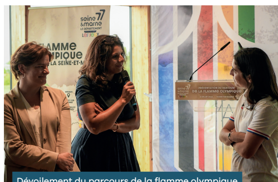
Dévoilement du parcours de la flamme olympique à Vaires-sur-Marne

En 2024, 24 sportifs dont 6 para-athlètes potentiellement médaillables aux Jeux composent la Team 77.