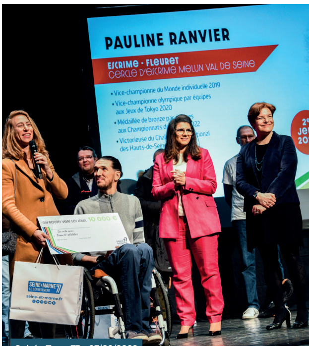
Soirée Team77 • 07/02/2023

PAULINE RANVIER ESCRIME - FLEURET Cercle d'escrime Melun Val de Seine • Vice-championne du Monde Individuelle 2019 • Vice-championne olympique par équipes aux Jeux de Tokyo 2020 • Médaille de bronze par équipes aux Championnats du Monde 2022 • Victorieuse du Challenge National des Hauts-de-Seine