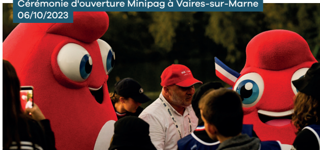
Cérémonie d'ouverture Minipag à Vaires-sur-Marne 06/10/2023

Revalorisation des subventions forfaitaires pour les licences jeunes, les licences adultes et les licenciés parasports quel que soit leur âge