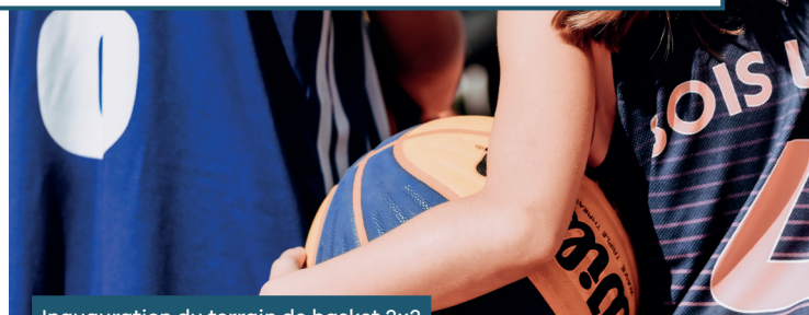
Inauguration du terrain de basket 3x3 de Bois-le-Roi • 03/09/2023

Depuis la mi-2023, le budget consacré aux subventions aux associations sportives a franchi le cap du