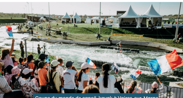
Coupe du monde de canoë-kayak à Vaires-sur-Marne 06/10/2023

Participation de 300 élèves de classes ULIS et 150 élèves d'écoles élémentaires à des animations sportives et éducatives pour valoriser la pratique du sport et, surtout, l'inclusion autour du sport partagé qui mêle pratiquants valides et pratiquants en situation de handicap