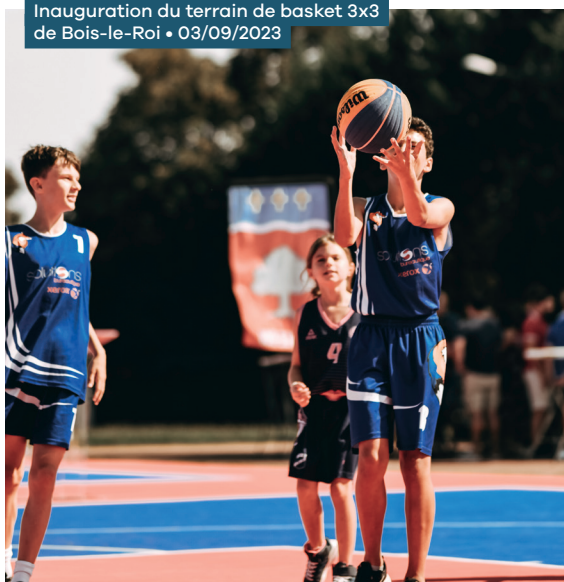
Inauguration du terrain de basket 3x3 de Bois-le-Roi • 03/09/2023

Lancement de l'appel à projets départemental basket 3x3, au printemps 2023 en partenariat avec l'Agence nationale du Sport :