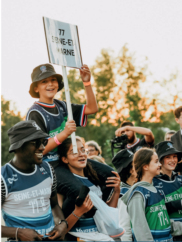
Cérémonie d'ouverture Minipag à Vaires-sur-Marne • 06/10/2023