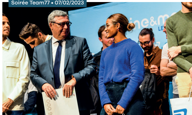
Soirée Team77 • 07/02/2023

Ouverture des bourses individuelles et de l'aide à l'entrée en pôle espoir aux athlètes de sports collectifs et non plus seulement aux sports individuels