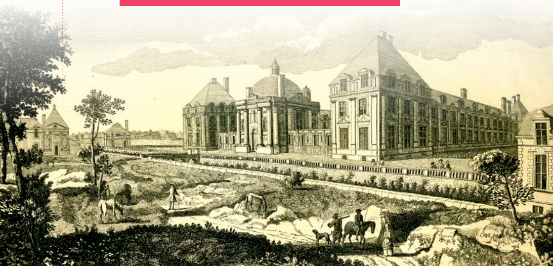
A View of the Royal Palace of Montceaux | Vue de la Maison Royale de Montceaux

Et aussi le 5 février à 15 h au musée de la Seine-et-Marne et le 11 février à 16 h au musée Bossuet