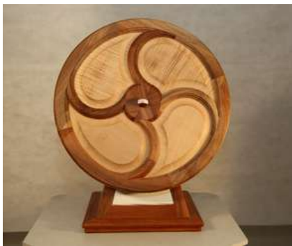
Objet en menuiserie

L'exposition présentera des maquettes d'affiliation et de réception, des maquettes de meilleurs apprentis, de reconnaissance, de commémoration.