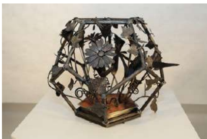
Dodécaèdre en ferronnerie