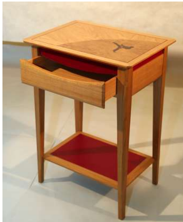
Guéridon en marqueterie