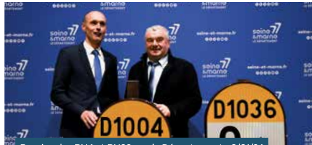
Reprise des RN4 et RN36 par le Département • 9/01/24

pour assurer la sécurité et le confort des Seine-et-Marnais qui les empruntent au quotidien. Depuis le 1 er janvier 2024, les RN4 et RN36 sont devenues des routes départementales, dénommées RD1004 et RD1036. L'ensemble du programme de remise en état des 69 kilomètres de la RD 1004 et des 39 kilomètres de la RD 1036 sera effectué d'ici 2026.