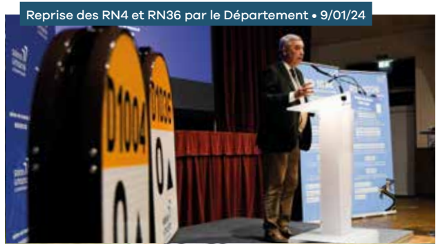
Reprise des RN4 et RN36 par le Département • 9/01/24