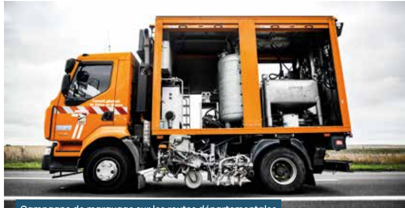
Campagne de marquage sur les routes départementales 09/08/23

pour l'entretien des couches de roulement et des ouvrages d'art