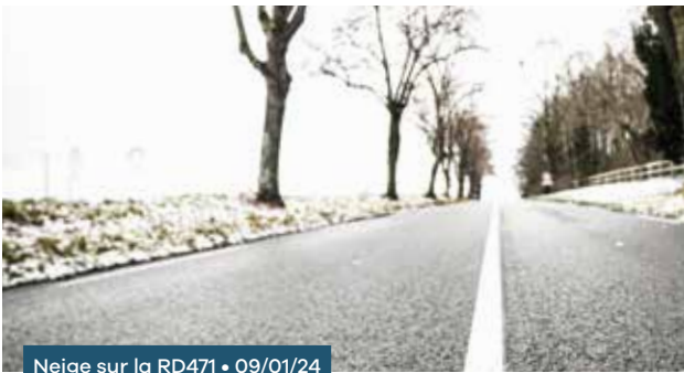
Neige sur la RD471 • 09/01/24