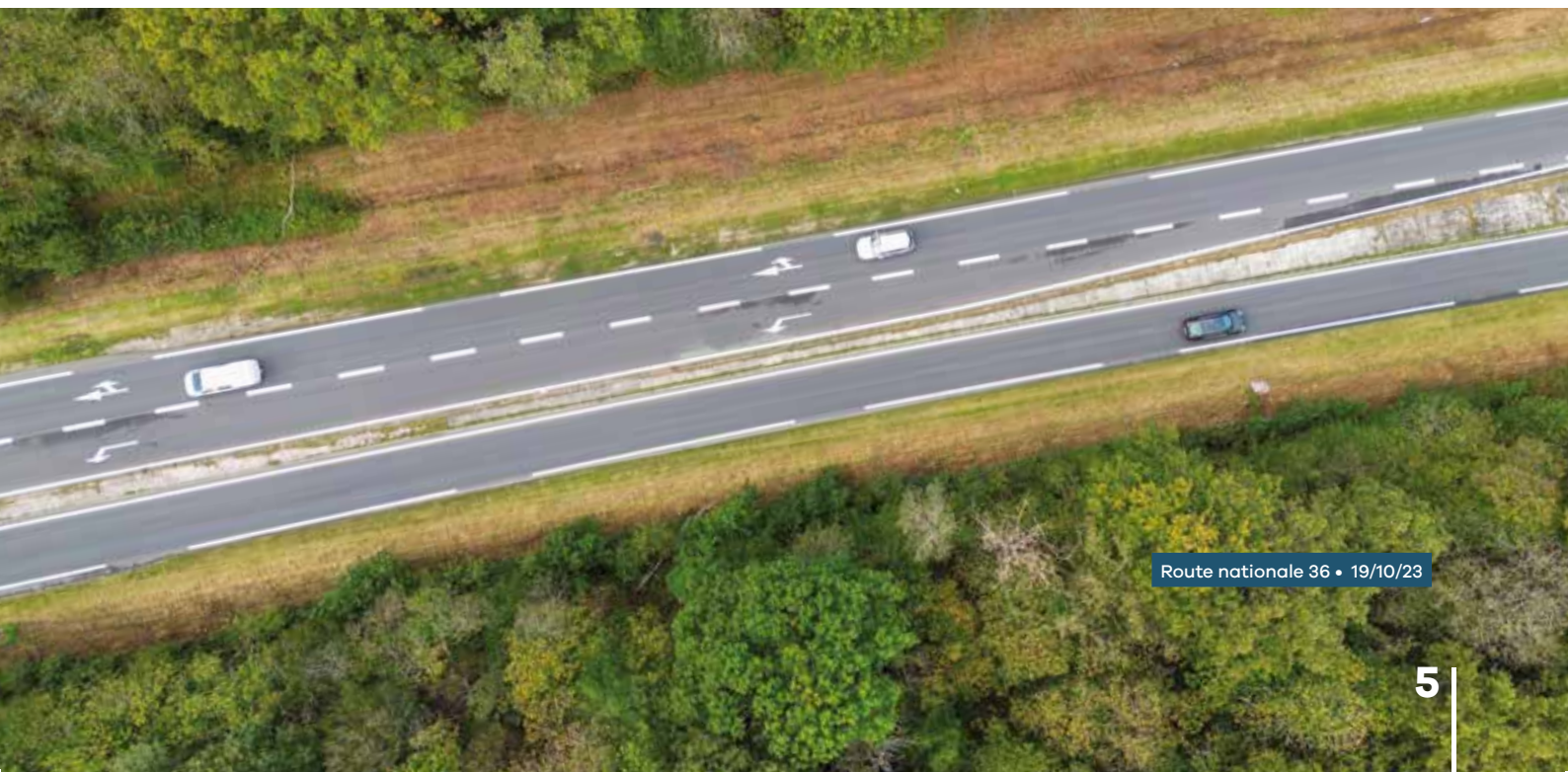
Route nationale 36 • 19/10/23