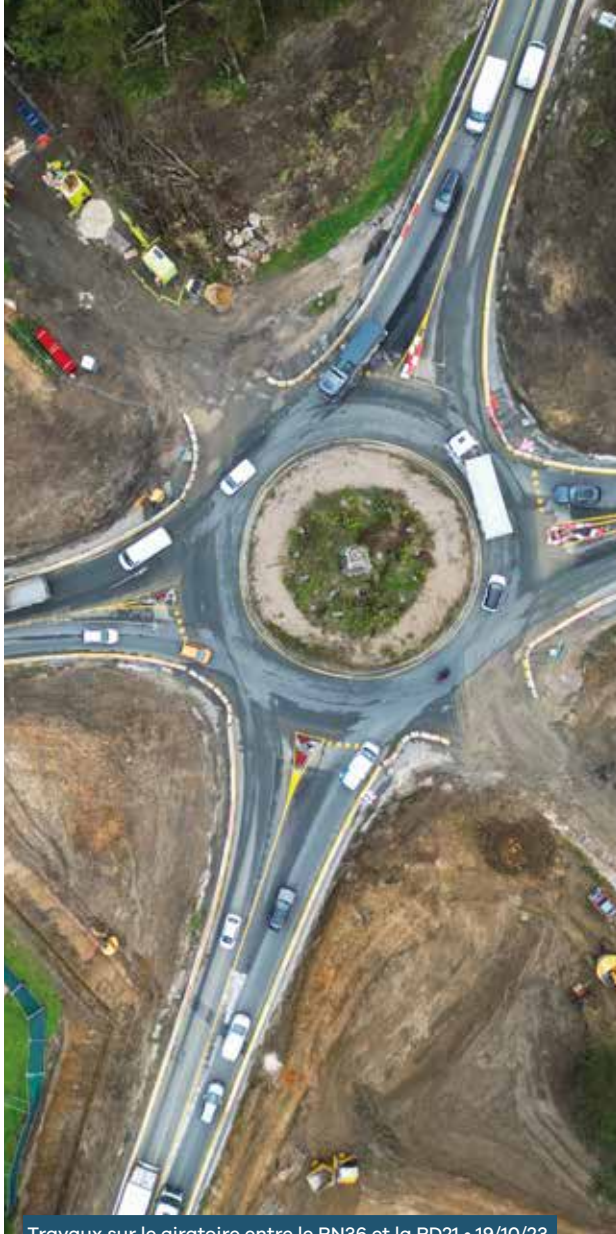
Travaux sur le giratoire entre le RN36 et la RD21 • 19/10/23