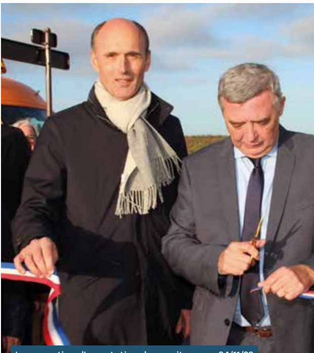
Inauguration d'une station de covoiturage • 24/11/22