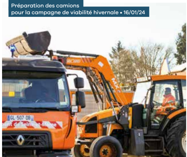
Préparation des camions pour la campagne de viabilité hivernale • 16/01/24