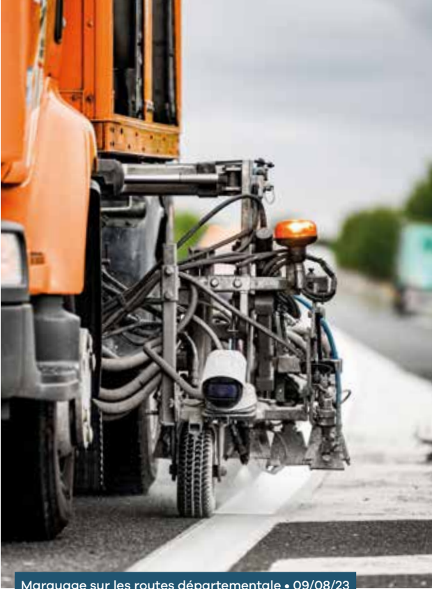
Marquage sur les routes départementale • 09/08/23