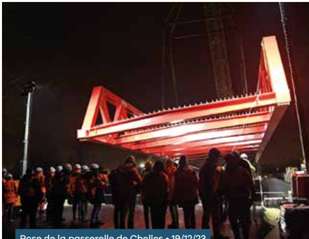
Pose de la passerelle de Chelles • 19/12/23

9 giratoires réalisés pour un montant de 8,8 M €