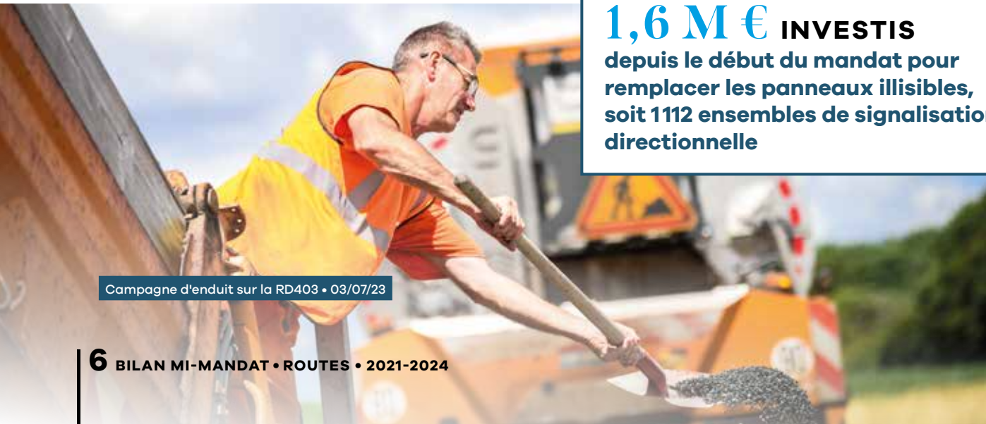
Campagne d'enduit sur la RD403 • 03/07/23

depuis le début du mandat pour remplacer les panneaux illisibles, soit 1112 ensembles de signalisation directionnelle