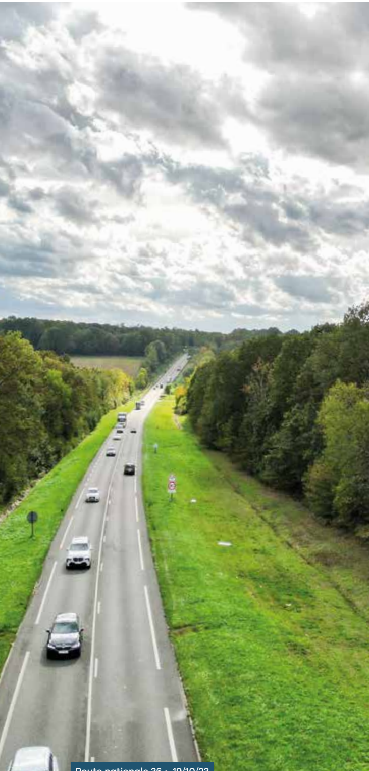
Route nationale 36 • 19/10/23