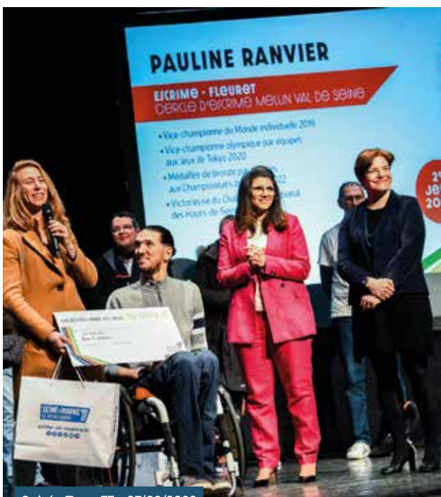
Soirée Team77 • 07/02/2023