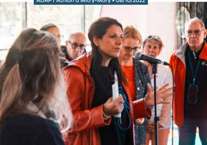
ADAPT'Athlon à Mitry-Mory • 08/10/2022