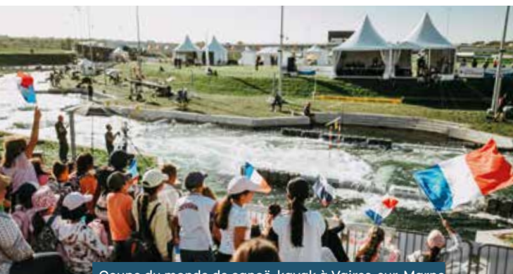
Coupe du monde de canoë-kayak à Vaires-sur-Marne 06/10/2023

Participation de 300 élèves de classes ULIS et 150 élèves d'écoles élémentaires à des animations sportives et éducatives pour valoriser la pratique du sport et, surtout, l'inclusion autour du sport partagé qui mêle pratiquants valides et pratiquants en situation de handicap