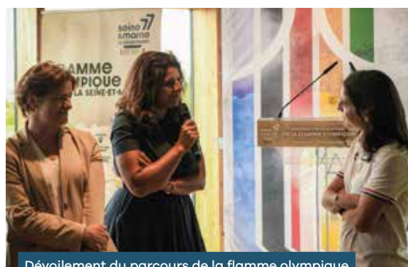
Dévoilement du parcours de la flamme olympique à Vaires-sur-Marne

En 2024, 24 sportifs dont 6 para-athlètes potentiellement médaillables aux Jeux composent la Team 77.