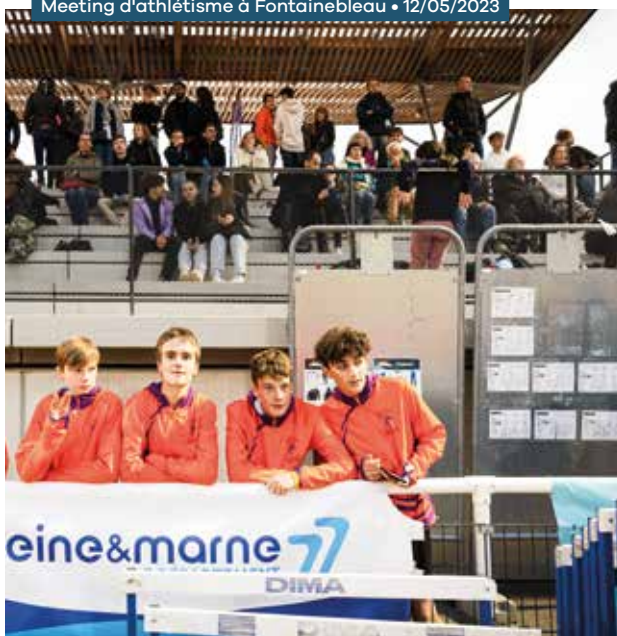
Meeting d'athlétisme à Fontainebleau • 12/05/2023

4 108 010 € mobilisés par le Département au titre de sa participation au coût de fonctionnement des équipements sportifs des collèges