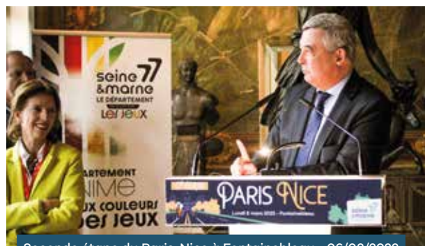
Seconde étape du Paris-Nice à Fontainebleau • 06/03/2023

Accueil le 6 mars 2023 de la 2 e étape du 81 e Paris-Nice, avec une traversée de Fromont, Amponville, La Chapelle-la-Reine et Ury avant l'arrivée à Fontainebleau