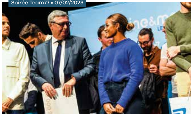
Soirée Team77 • 07/02/2023

Ouverture des bourses individuelles et de l'aide à l'entrée en pôle espoir aux athlètes de sports collectifs et non plus seulement aux sports individuels