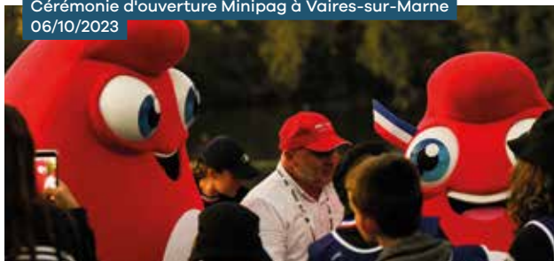
Cérémonie d'ouverture Minipag à Vaires-sur-Marne 06/10/2023

Revalorisation des subventions forfaitaires pour les licences jeunes, les licences adultes et les licenciés parasports quel que soit leur âge