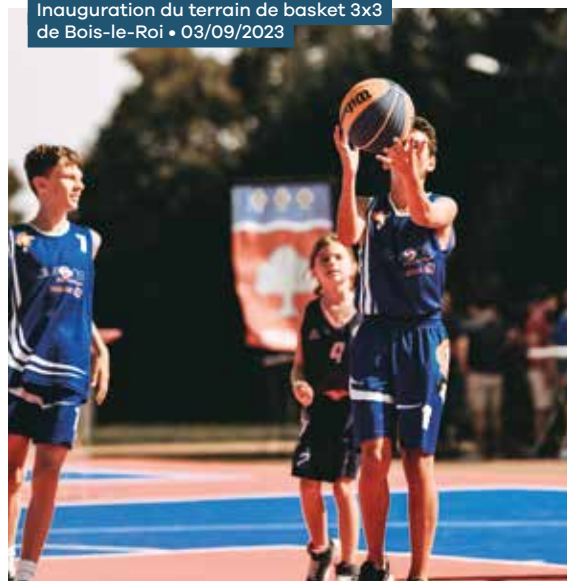
Inauguration du terrain de basket 3x3 de Bois-le-Roi • 03/09/2023

Lancement de l'appel à projets départemental basket 3x3, au printemps 2023 en partenariat avec l'Agence nationale du Sport :