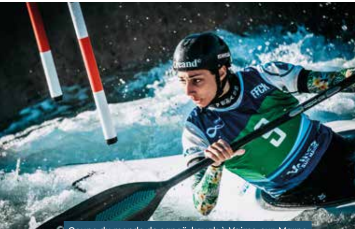
Coupe du monde de canoë-kayak à Vaires-sur-Marne 06/10/2023