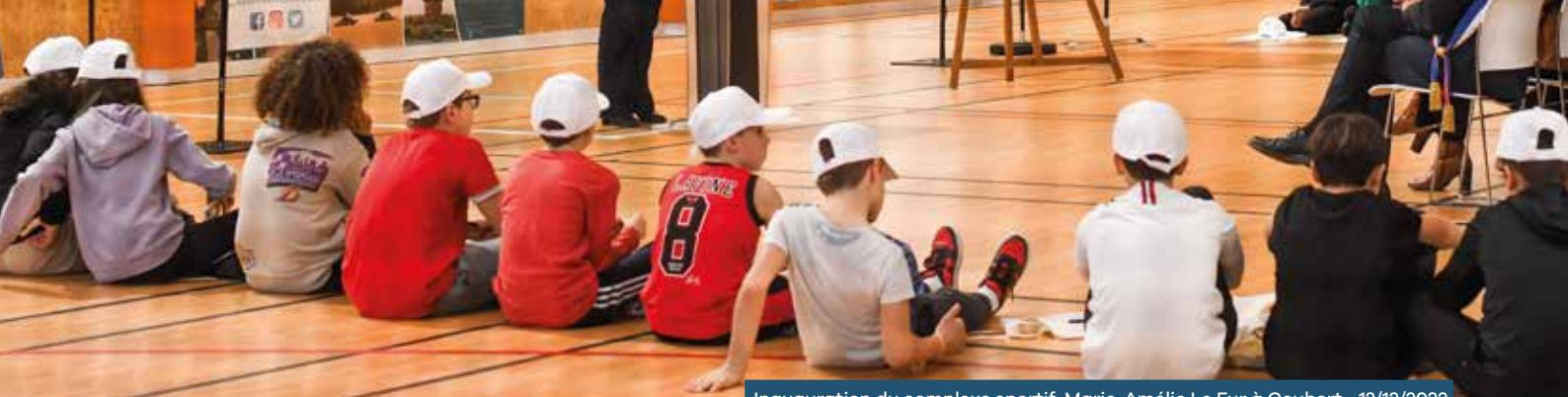
Inauguration du complexe sportif Marie-Amélie Le Fur à Coubert • 12/12/2023