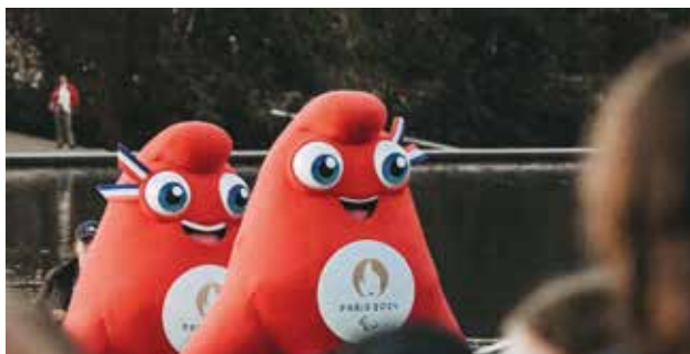
Cérémonie d'ouverture Minipag à Vaires-sur-Marne • 06/10/2023