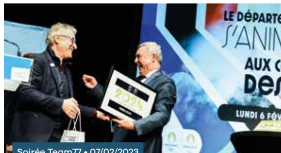
Soirée Team77 • 07/02/2023