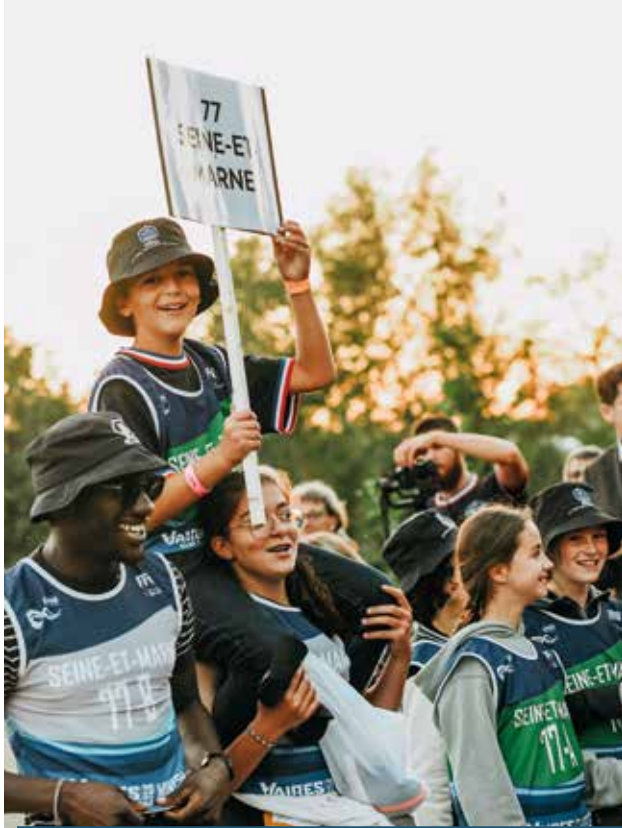
Cérémonie d'ouverture Minipag à Vaires-sur-Marne • 06/10/2023