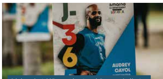
Cérémonie J-365 avant les Jeux à Dammarie-lès-Lys

173 volontaires formés gratuitement (anglais, PSC1, culture olympique, participation aux événements sportifs sur le territoire) dont près de 90 ont intégré le programme Volontaires de Paris 2024