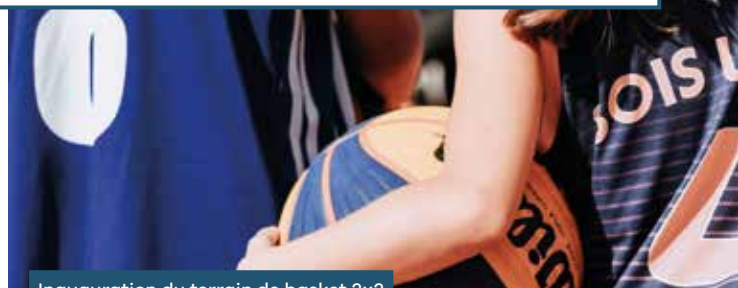
Inauguration du terrain de basket 3x3 de Bois-le-Roi • 03/09/2023

Depuis la mi-2023, le budget consacré aux subventions aux associations sportives a franchi le cap du