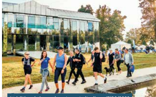
1 re édition de la rando nature et citadine • 17/09/2023