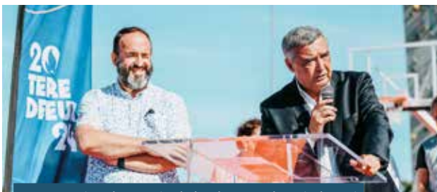
Inauguration du terrain de basket 3x3 de Bois-le-Roi 03/09/2023