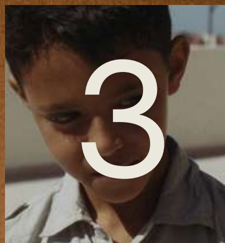
Saïd Hamich Benlarbi, Le Départ (2020)