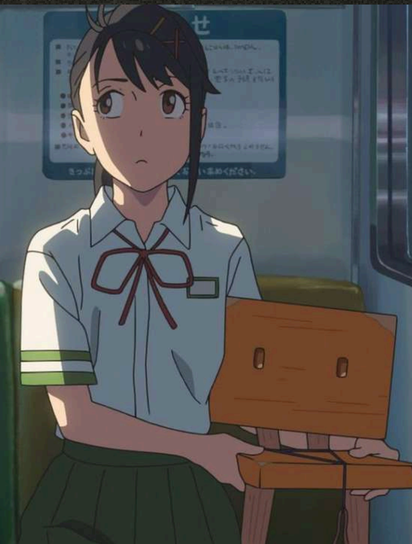
Makoto Shinkai, Suzume (2024)