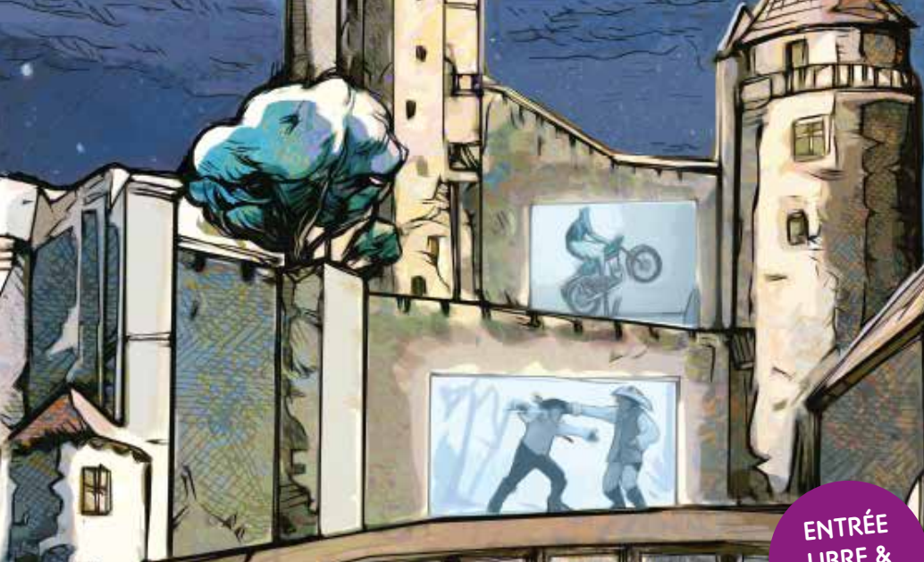
Illustration © Amaury Esteban