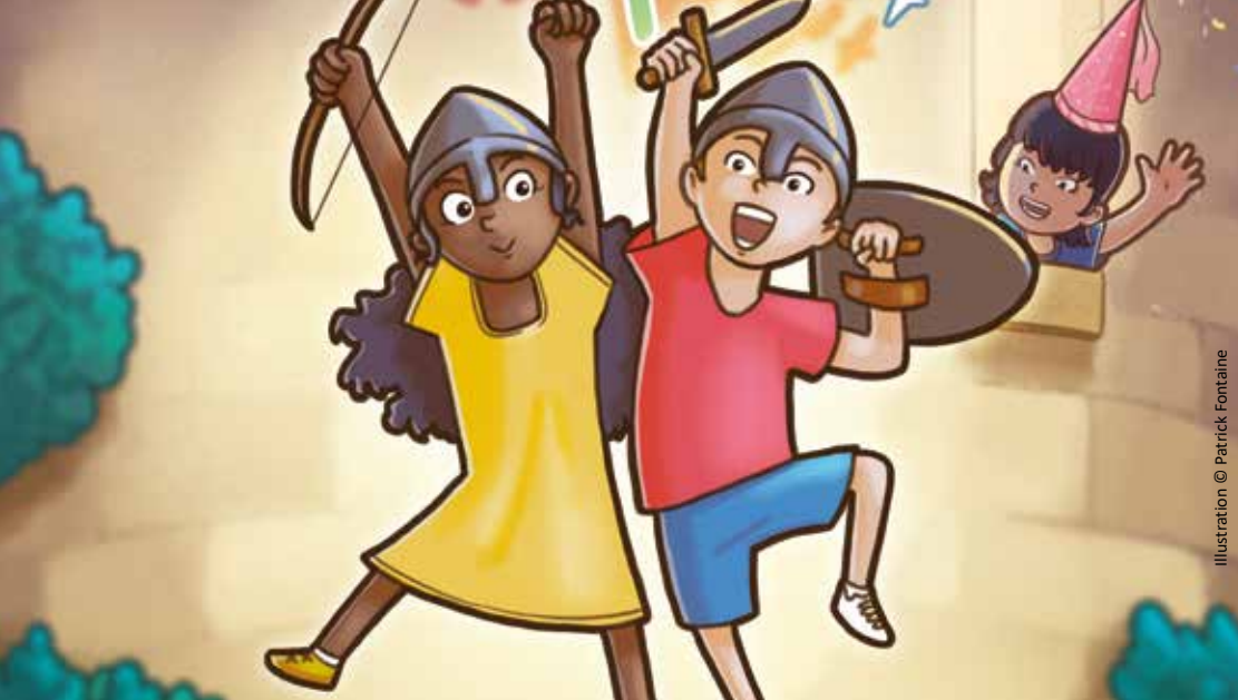
Illustration © Patrick Fontaine