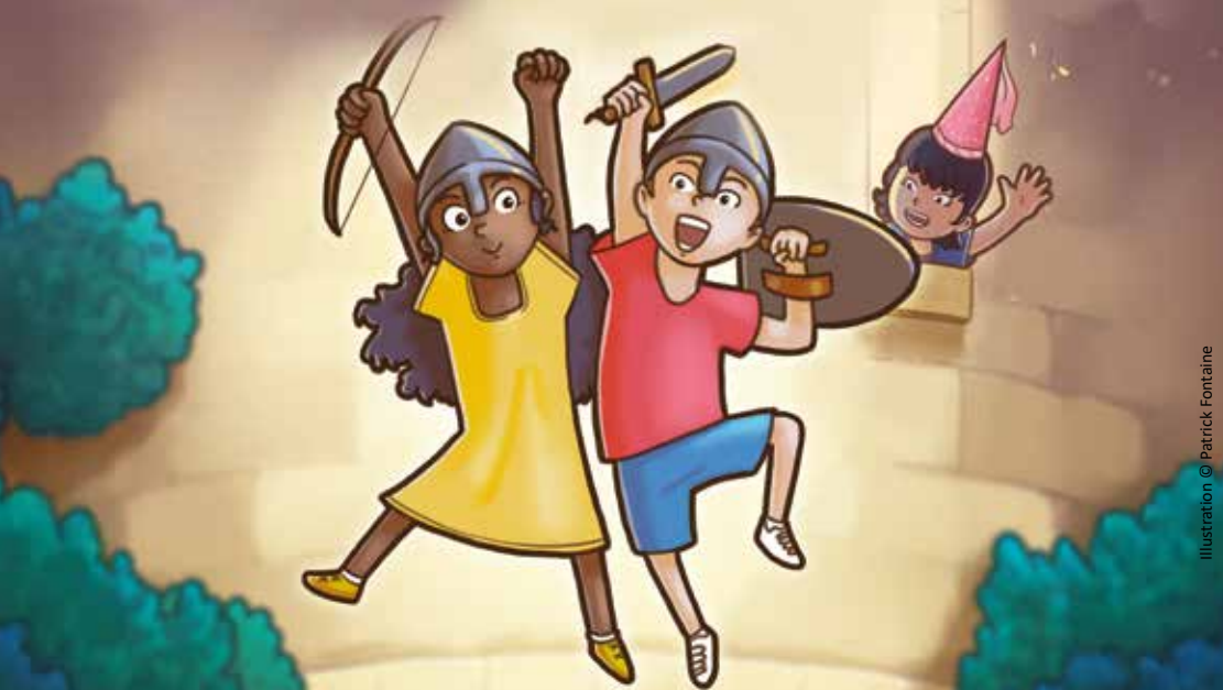
Illustration © Patrick Fontaine